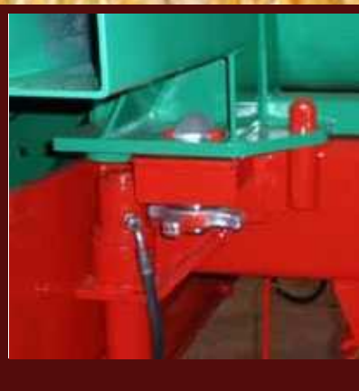
Zajištění Twist-Lock s upevněním pro odstavené opěry