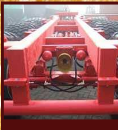
Třínápravový podvozek se sériovým pohonem vývodovým hřídelem pro pohony nástaveb