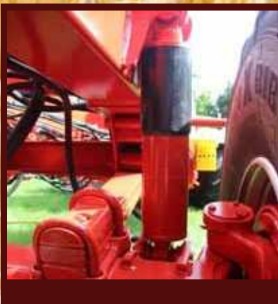
Podvozek s hydraulickým odpružením podvozku