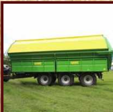
Nástavba vyklápěcího vozu v různých provedeních s objemem od 22 do 44 kubických metrů