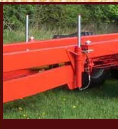
Zvedací válce pro odstavení a upevnění různých nástaveb