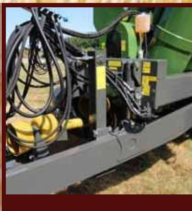
Hydraulicky ovládaná podpěrná noha a hydraulické odpružení tažné oje