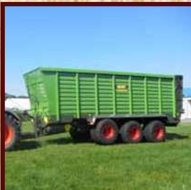
Nástavba transportního vozu na siláž s objemem 38 až 50 kubických metrů