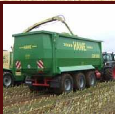
Nástavba nákladního vozu s výtláčným čelem s objemem 40 nebo 50 kubických metrů